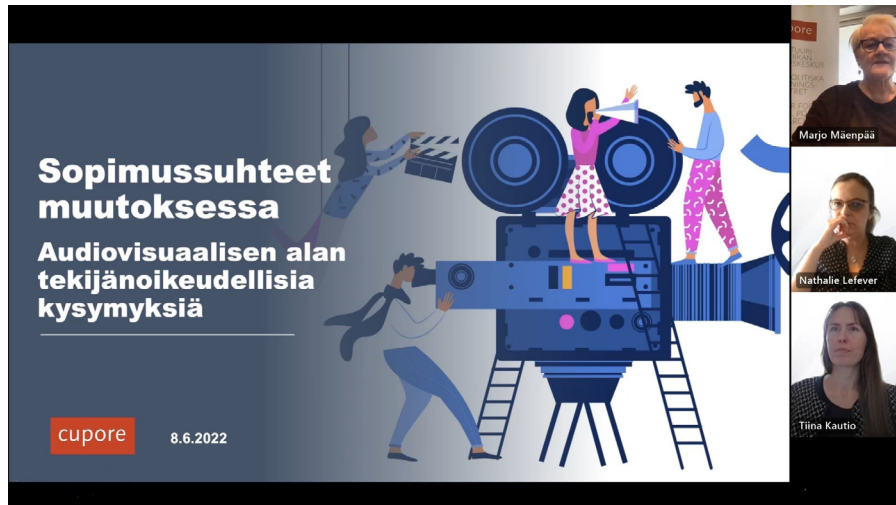
TEKIJÄNOIKEUSKYSYMYKSIÄ AUDIOVISUAALISELLA ALALLA KÄSITELLEN TUTKIMUKSEN TULOKSIA ESITELTIIN WEBINAARISSA KESÄKUUSSA 2023.