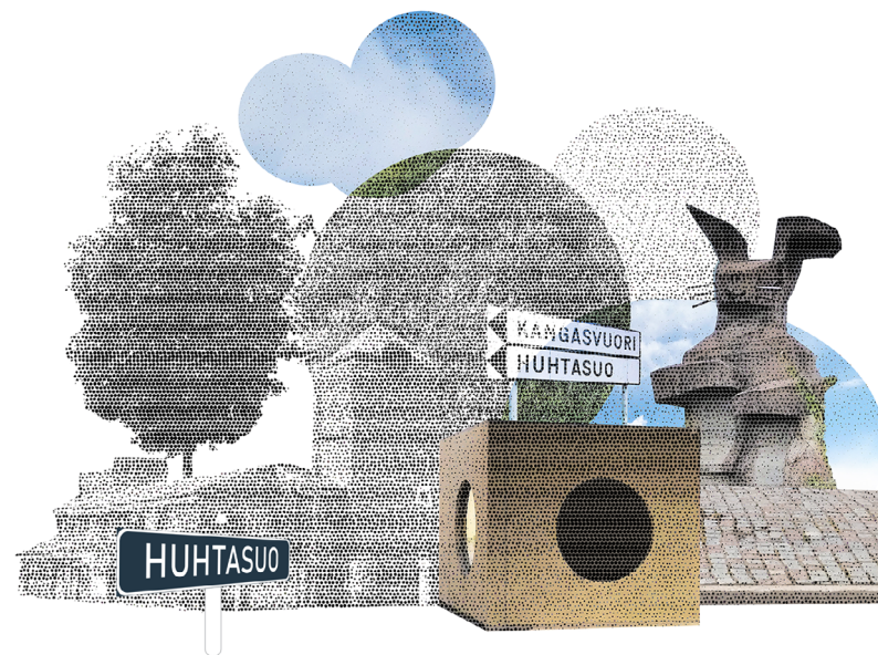
KUVITUS: TIINA PAJU

Lue lisää verkkosivuiltamme: https://www.cupore.fi/fi/tutkimus/tutkimushankkeet/lahio