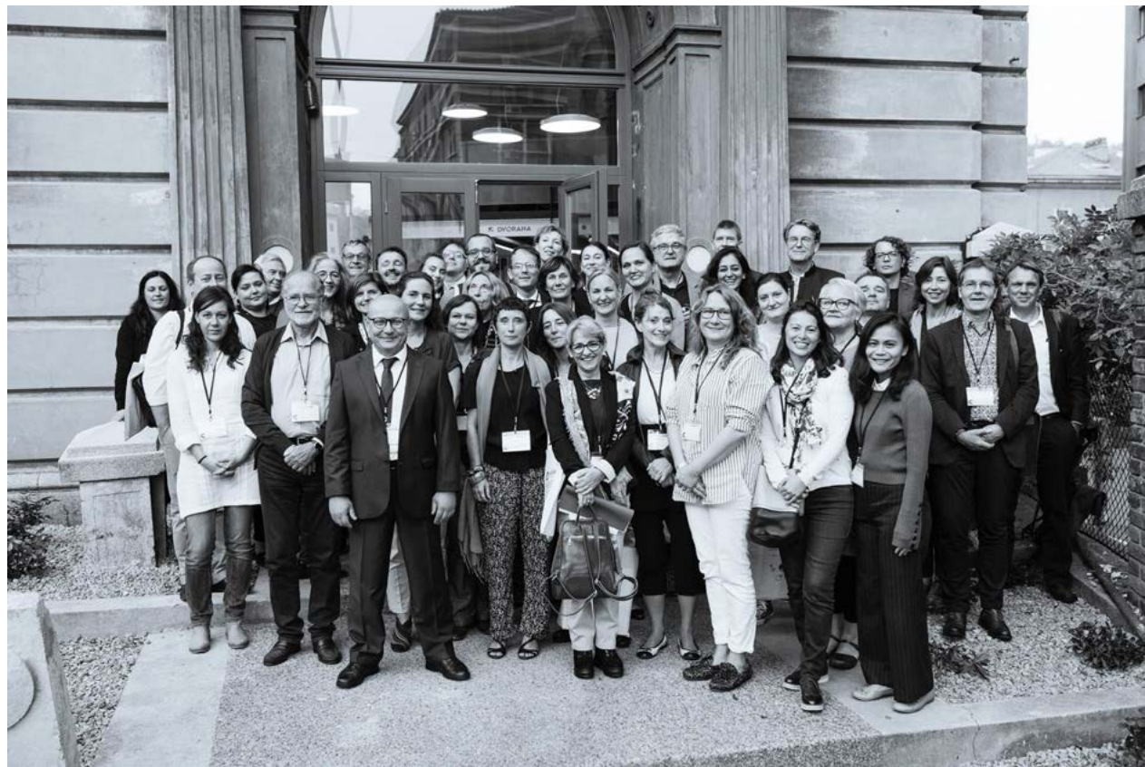
COMPENDIUM GENERAL ASSEMBLY RIJEKASSA KROATIASSA 9.-10.10.2018.