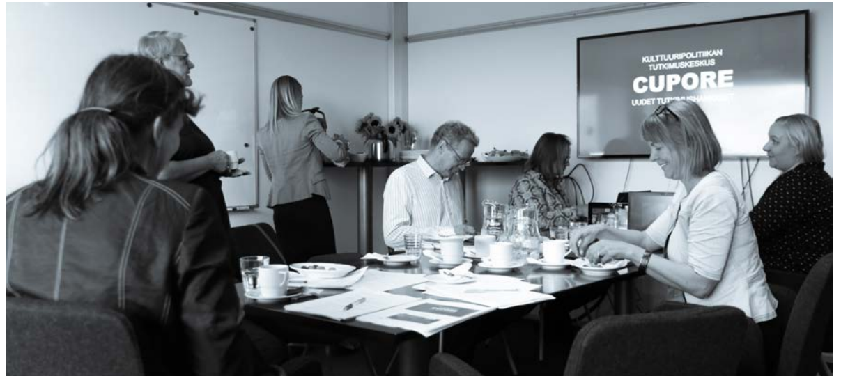
UUDEN HALLITUKSEN ENSIMMÄINEN KOKOUS.

Kulttuuripoliittisen tutkimuksen edistämissäätiön asioita hoitaa, sitä edustaa ja sen päätösvaltaa käyttää hallitus.