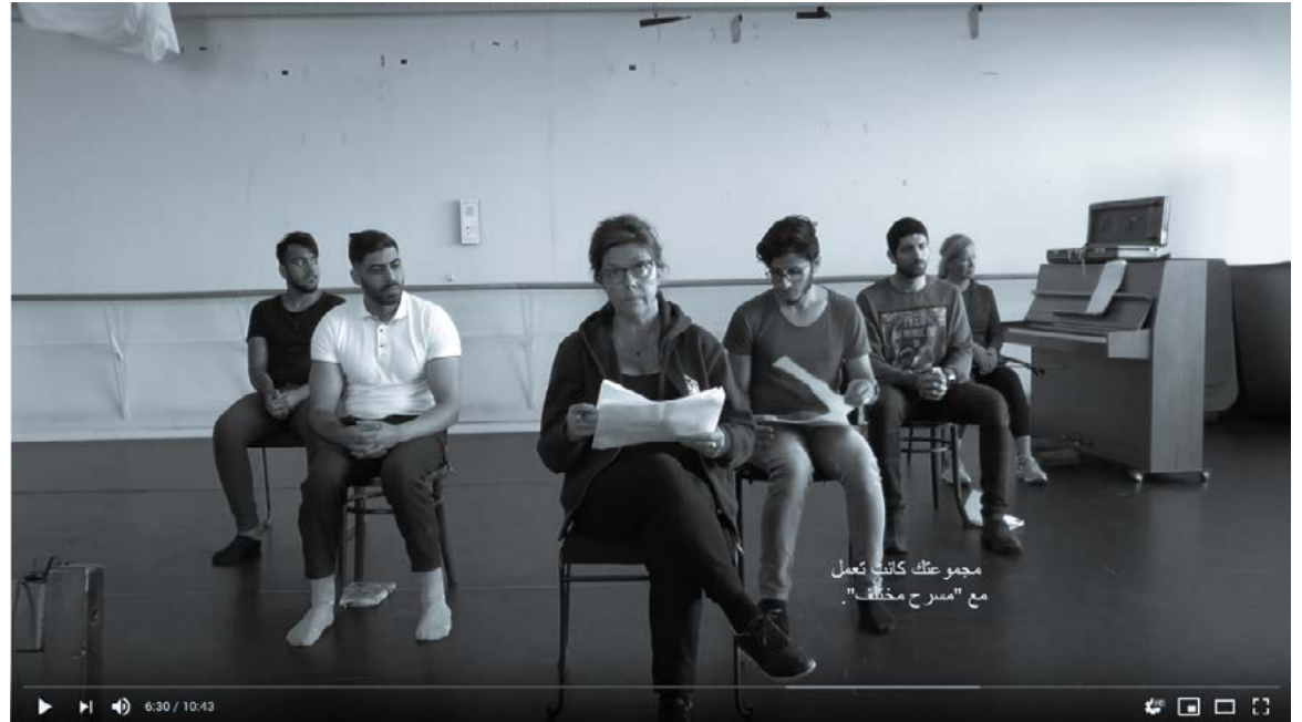
HARJOITUSTUOKIO TOINEN KOTI -ESITYKSESTÄ KERTOVASSA LYHYTELOKUVASSA.

Toinen koti (Other Home) subtitled in Arabic https://www.youtube.com/watch?v=fTLJc-gWG6WY