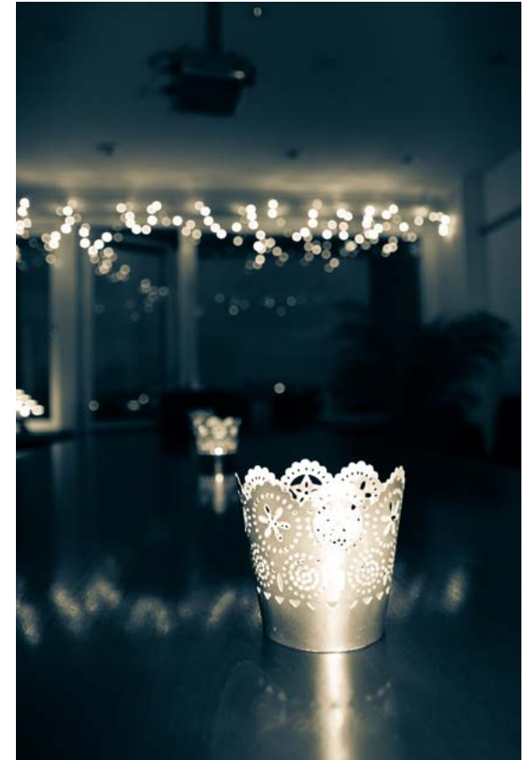
CUPOREN JOULUTUNNELMAA.

Organisaatiotason kehittämishankkeitamme olivat Cuporen strategian päivitystyön aloitus, työntekijän oppaan sekä aineistohallintaan liittyvän ohjeistuksen päivittäminen. Virkistyspäivää vietettiin Nuuksiossa 30.10. ja pikkujouluja juhliittiin 29.11. keilaamalla ja illallisella.