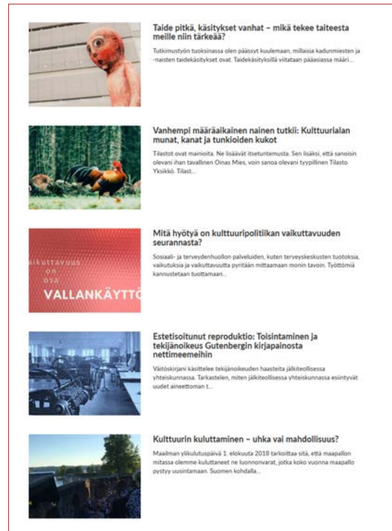
BLOGIKIRJOITUKSIA VUODELTA 2018

Seuraajien määrä kasvoi niin Facebookissa, Twitterissä kuin Instagramissakin. Facebook-sivustolla oli vuoden alussa 771 tykkääjää ja vuoden lopussa 911. Tykkääjiä kertyi siis 140 henkilöä lisää. Cupore päivitti kuulumisiaan Facebookiin keskimäärin joka toinen päivä, vuoden aikana tehtiin 183 postaus. Twitterissä Cupore julkaisi 227 päivitys-