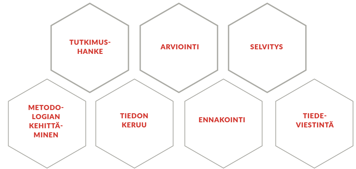
Kuvio 2. Kulttuuripolitiikan tutkimus.

Cuporen asema päätöksenteon sekä tutkimuksen välissä on ainutlaatuinen.