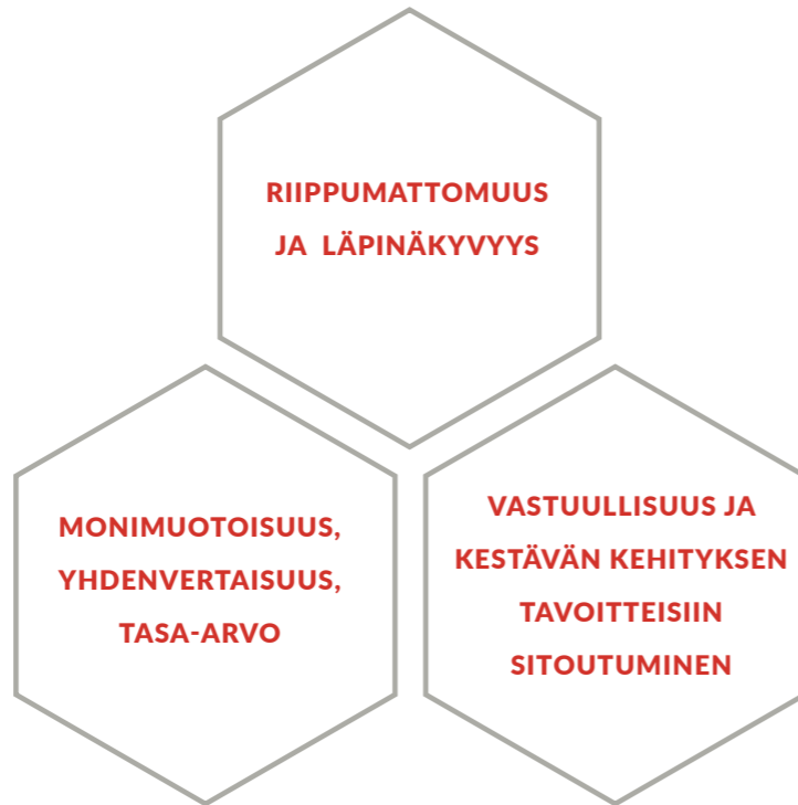
Kuvio 3. Cuporen arvot.