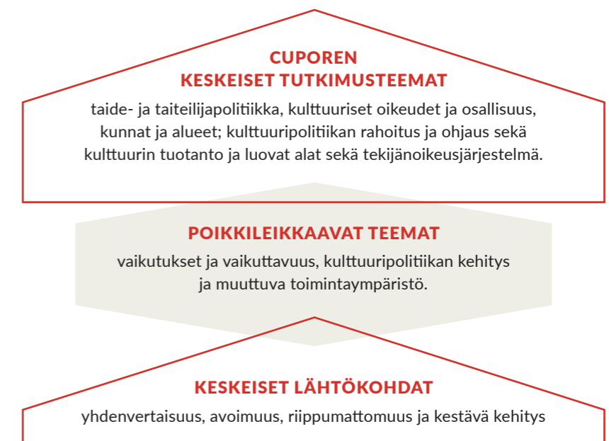
Kuvio 1. Cuporen keskeiset tutkimusteemat ja lähtökohdat.